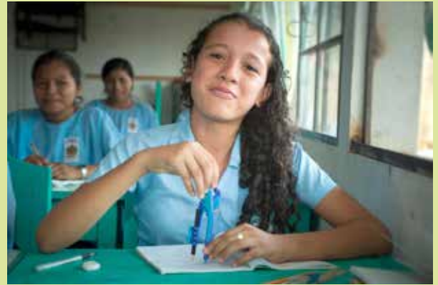
Photograph. Student at the Ratz'um K'iché Educational Center in Boloncó. Photograph belonging to the exhibition "Guatemala. Childhood in the Mayan heart". Year 2011.

Many activities aimed at sustainability could be highlighted, but I would like to speak more in depth about the commercial bakery. This activity is generating a fixed income for the Center, generating as well jobs in the area, and benefiting the women from the town who resell bread in the Village. The impact of this activity and others is being very high.