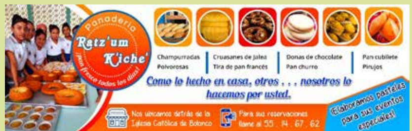
Photograph. Advertisement for the commercial bakery in the center of Boloncó .