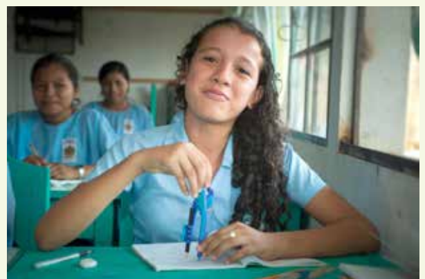
Foto. Estudiante en el Centro Educativo de Ratz'um K'iché de Boloncó. Fotografía perteneciente a la muestra "Guatemala. Infancia en el corazón maya". Año 2011.

Ante el contexto de pobreza y falta de oportunidades en el que estaban trabajando se diseñó una estrategia de actuación para poder obtener resultados sostenibles tanto para el propio centro como para el futuro de la mujer indígena en la zona. El camino no ha sido sencillo debido a la situación en la zona y retrasos culturales en aspectos de género, pero ya vemos resultados.