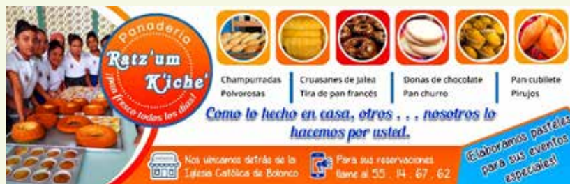
Foto. Anuncio de la panadería comercial del Centro de Bolonco.

Podría destacar muchas actividades encaminadas a la sostenibilidad, pero destaco la panadería comercial. Esta actividad está generando unos ingresos fijos al Centro, generando puestos de trabajo en la zona, y beneficiando a mujeres del pueblo que revenden el pan en la Aldea. El impacto de esta actividad y otras está siendo muy elevado.